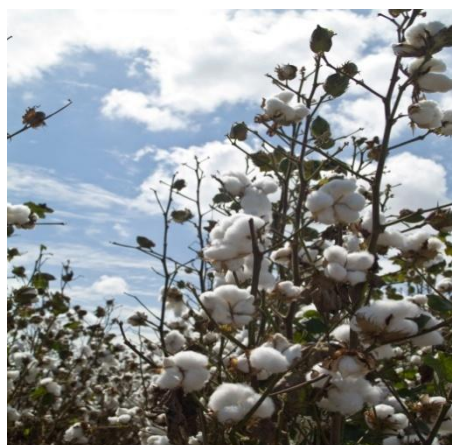
La tasa promedio semanal de Fibra de algodón fue de 9.25%

El índice de la tasa de las operaciones financieras de la Bolsa subió 2 puntos básicos, debido a operaciones de CDM de Arroz blanco importado y fibra de algodón.