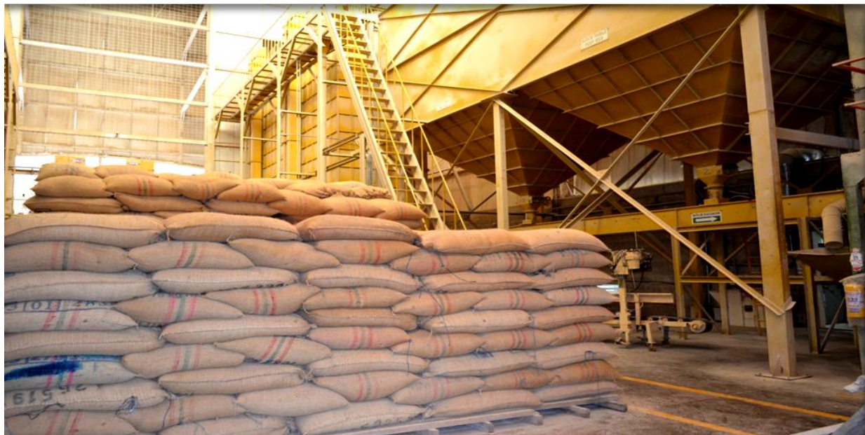
Locacion: Fedearroz, Restrepo, Meta.