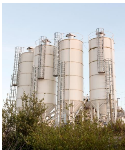
SILOS DE ALMACENAMIENTO

El índice de la tasa de las operaciones financieras de la Bolsa se comportó estable, con un índice iRent de 10.20%.