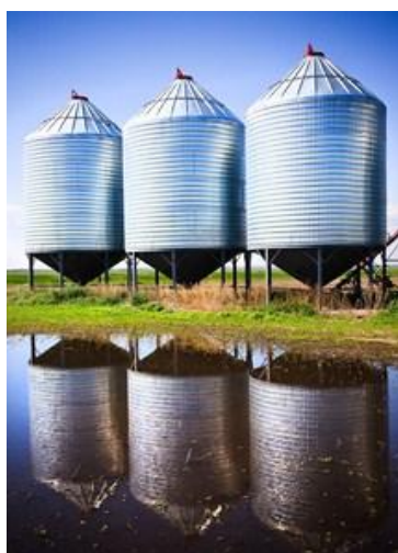
SILOS DE ALMACENAMIENTO

El índice de la tasa de las operaciones financieras de la Bolsa se comporto estable, con un índice iRent de 10.20%.