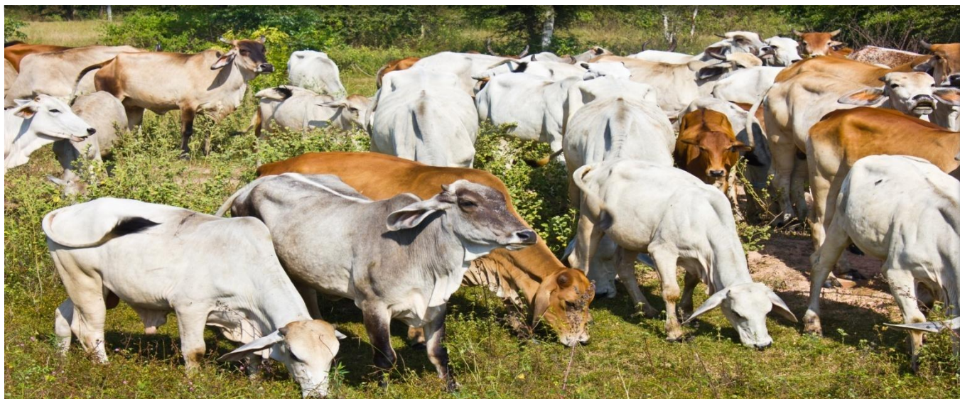
El sector ganadero ha presentado el mayor número de transacciones ingresadas al Sistema de Registro de la Bolsa, en lo corrido de 2016.