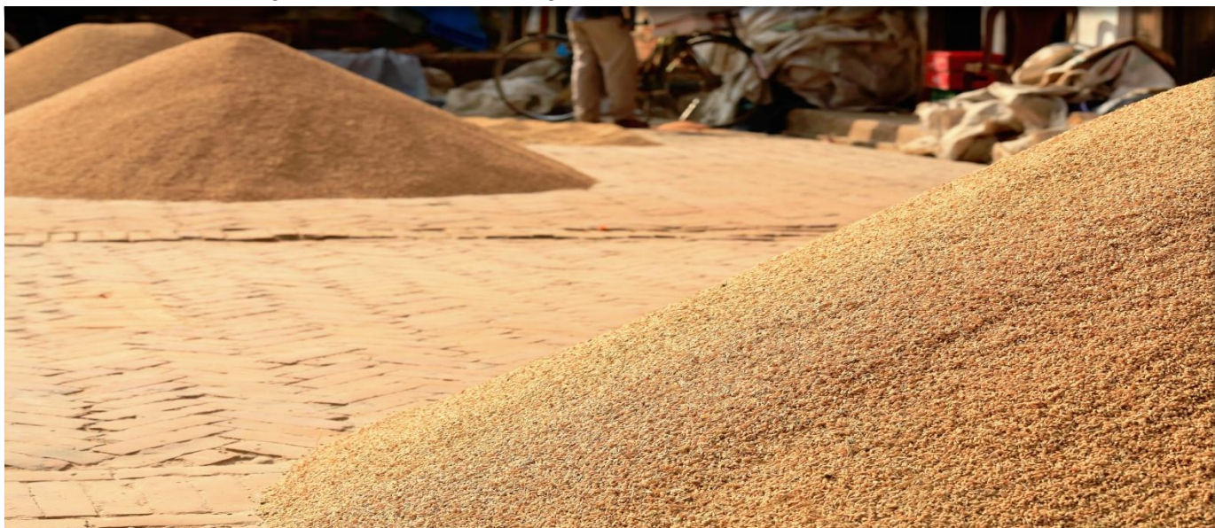
Arroz paddy nacional, uno de los productos con mayor registro en lo corrido de 2016.