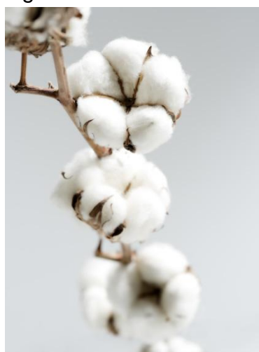
Fibra de algodón

El índice de la tasa de las operaciones financieras de la Bolsa aumento 38 puntos básicos, para registrar así un índice iRent de 10.38%.