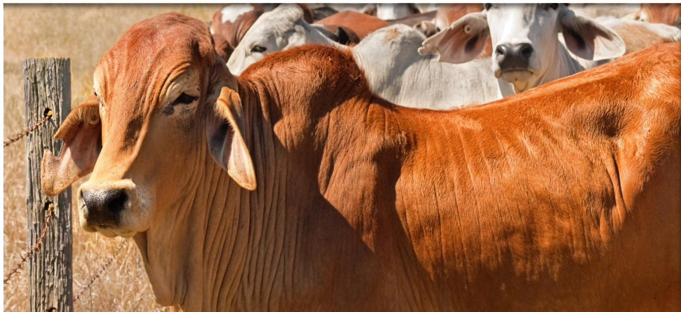
El sector ganadero ha presentado el mayor número de transacciones ingresadas al Sistema de Registro de la Bolsa, en lo corrido de 2016.