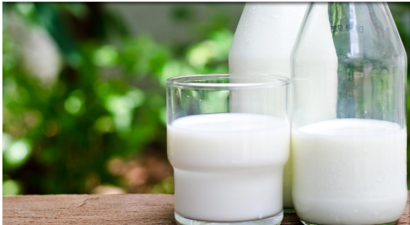
La leche cruda tuvo un precio promedio de $ 1,088 por litro en el sistema de registro de la Bolsa Mercantil de Colombia.