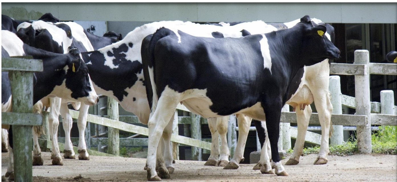
El sector ganadero ha presentado el mayor número de transacciones ingresadas al Sistema de Registro de la Bolsa durante el 2016.