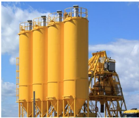
SILOS DE ARROZ

El índice de la tasa de operaciones financieras de la Bolsa Mercantil de Colombia S.A., disminuyó 4 puntos básicos y registró una tasa IRent de 12.00%.