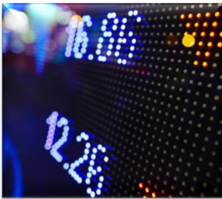
Índice de las Tasas Financieras de la Bolsa Mercantil de Colombia S.A.

El índice de la tasa de operaciones financieras de la Bolsa Mercantil de Colombia S.A., registró una tasa iRent de 12.25%.