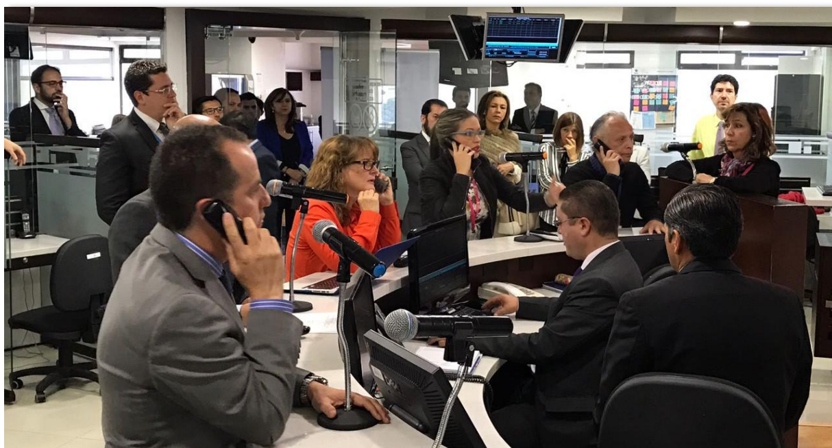
Foto: Rueda de Negocios, Bolsa Mercantil de Colombia.

En el Mercado de Compras Públicas, MCP, se negoció servicio de vigilancia electrónico por $33,497 millones.