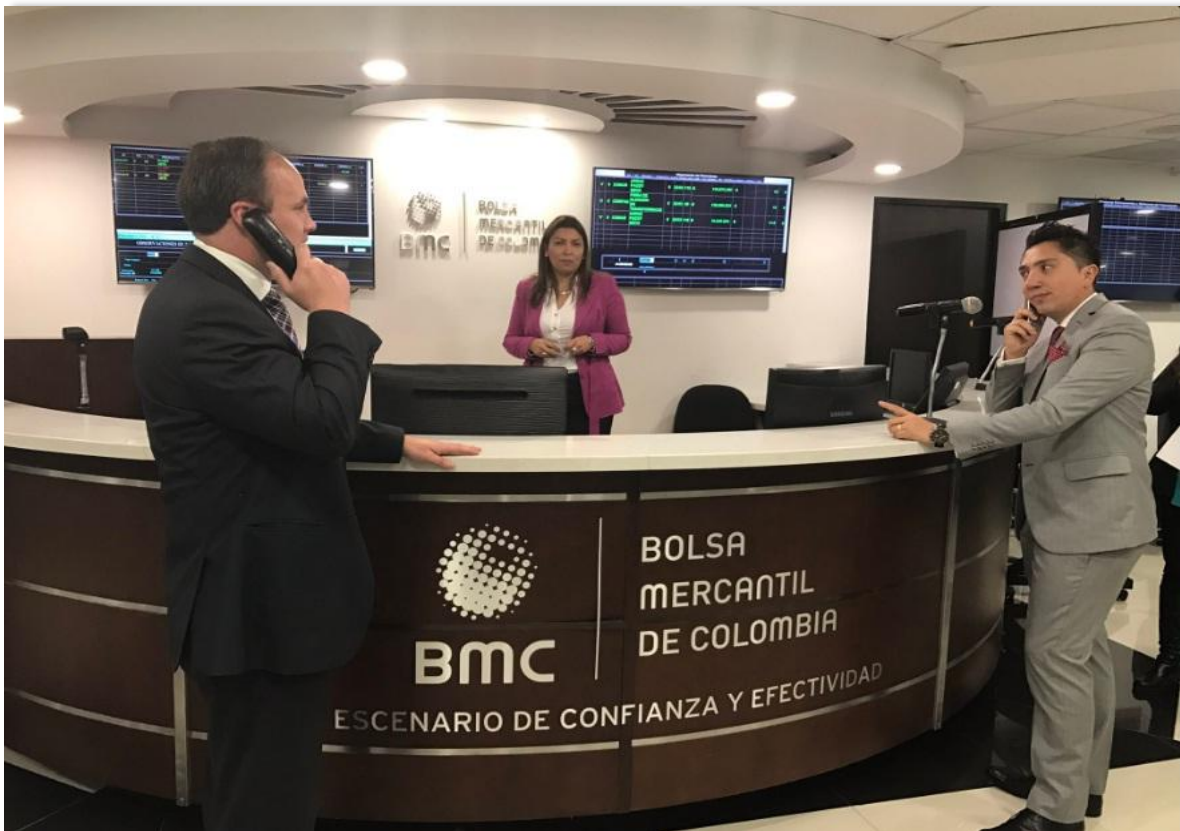
Firmas comisionistas miembros de la Bolsa durante la compra de Globos meteorológicos para el IDEAM, en la Rueda de Negocios de la Bolsa

Operaciones más representativas del Mercado de Compras Públicas, MCP, el 22 de marzo de 2017: