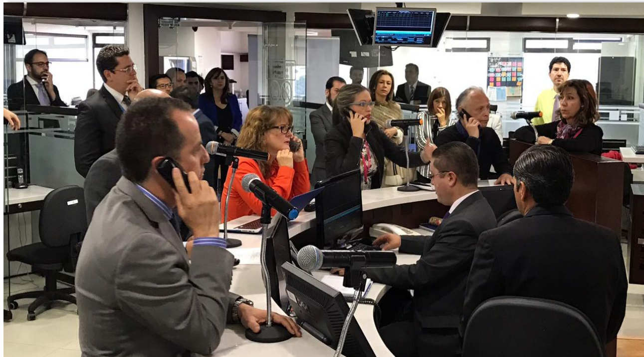
Firmas Comisionistas miembros de la Bolsa Mercantil de Colombia durante negociaciones del Mercado de Compras Públicas en la Rueda de Negocios.

Las siguientes fueron las operaciones más representativas del Mercado de Compras Públicas, MCP, el 4 de abril de 2017