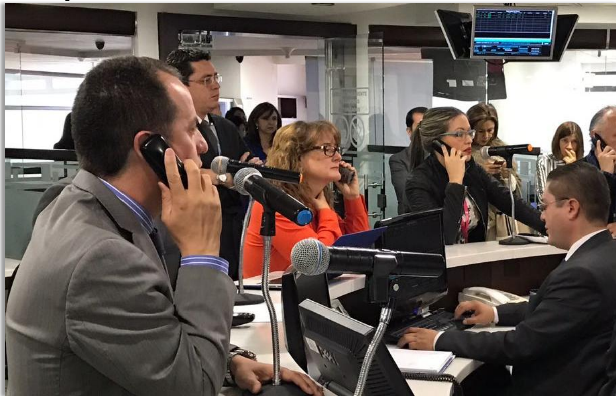
Rueda de Negocios de la Bolsa Mercantil de Colombia