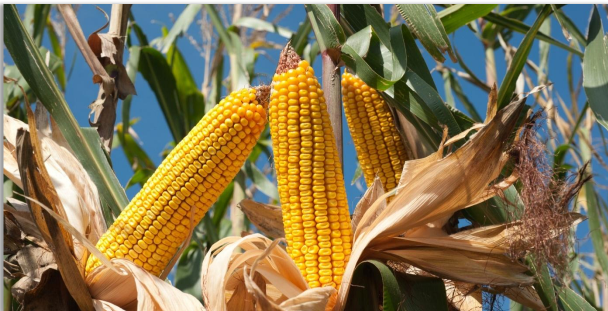
Al Sistema de Registro de la Bolsa Mercantil de Colombia se ingresaron 9,904 toneladas de maíz amarillo.