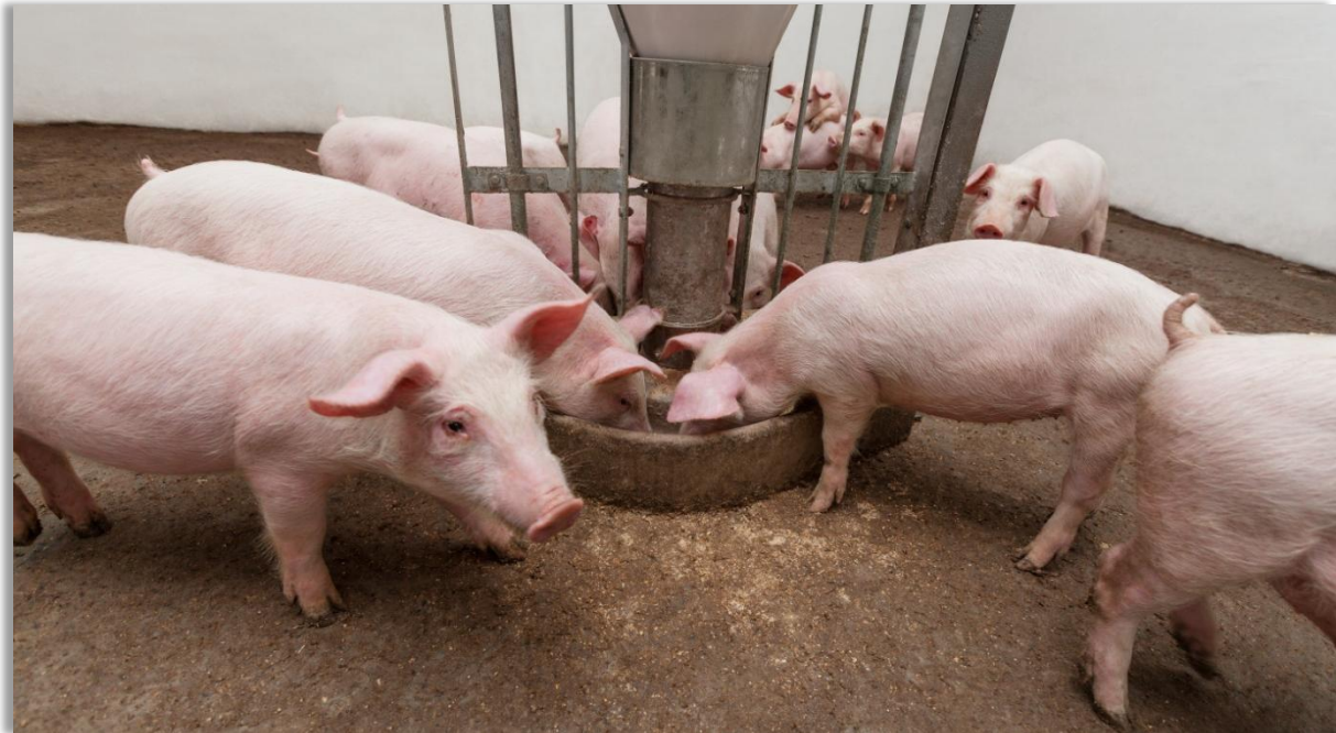
El 17 de julio de 2017 ingresaron 2,574 kilos de alimento concentrado para cerdos al Sistema de Registro de la Bolsa Mercantil de Colombia.