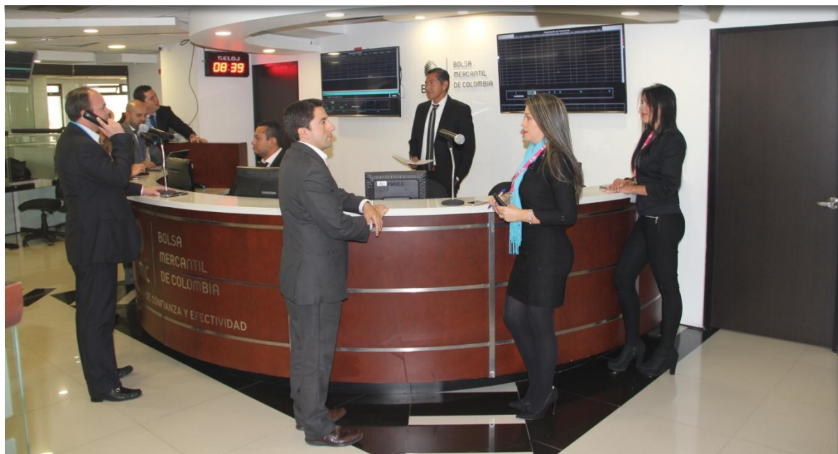
Rueda de Negocios de la Bolsa Mercantil de Colombia