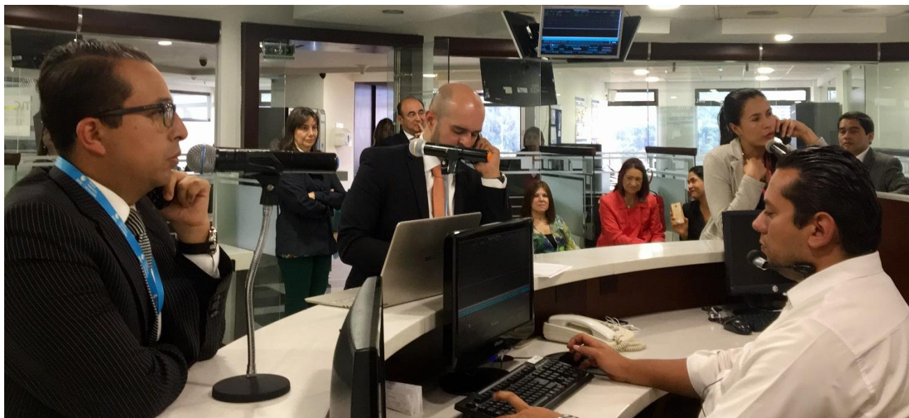
En la semana del 9 al 13 de octubre se negociaron $113,647 millones de pesos en el Mercado de Compras Públicas, MCP.

En la semana del 9 al 13 de octubre de 2017 en la Bolsa Mercantil de Colombia se realizaron transacciones por un total de $509 mil millones , distribuidos de la siguiente manera: en el Sistema de Registro, $395 mil millones ; en el Mercado de Compras Públicas las entidades estatales hicieron adquisiciones por $113,647 millones , en el Mercado de Repos sobre CDM se hicieron operaciones por $206 millones .